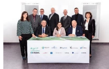
Création association Iba-Parc des carrières 16.04.2019