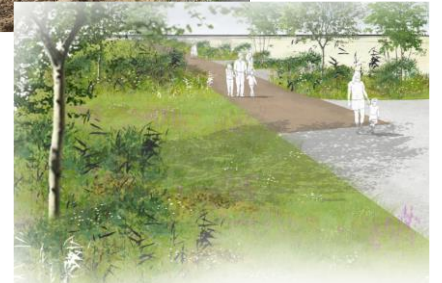
Après : prairie et cheminements