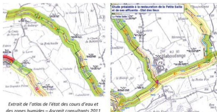
Extrait de l'atlas de l'état des cours d'eau et des zones humides - Asconit consultants 2011

Les difficultés rencontrées concernent l'anticipation de l'entretien des haies plantées dans les années à venir.