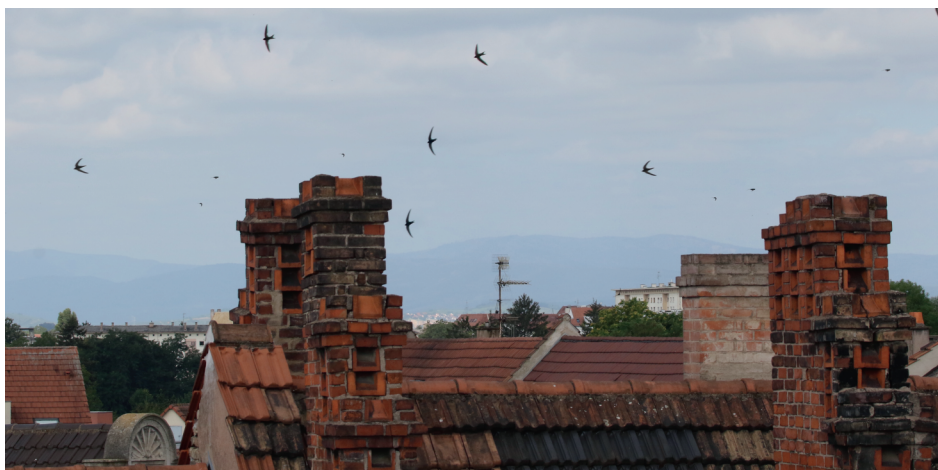
Vol de Martinets noirs à Strasbourg - Jean-Marc Bronner