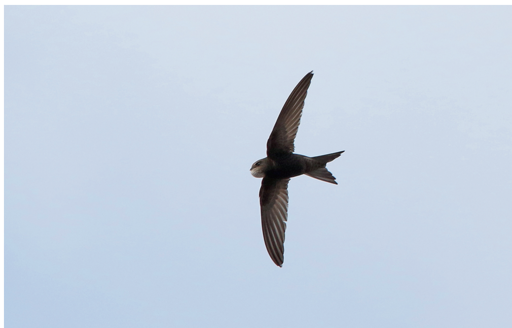
Martinet noir au jabot gonflé - Jean-Marc Bronner

Observé dans près de 1000 communes de la région