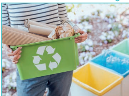
Bacs de tri