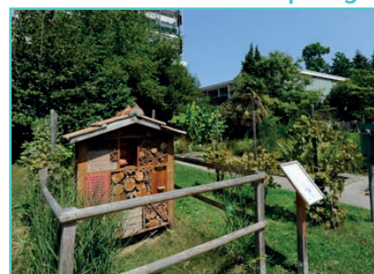
Hôtels à insectes