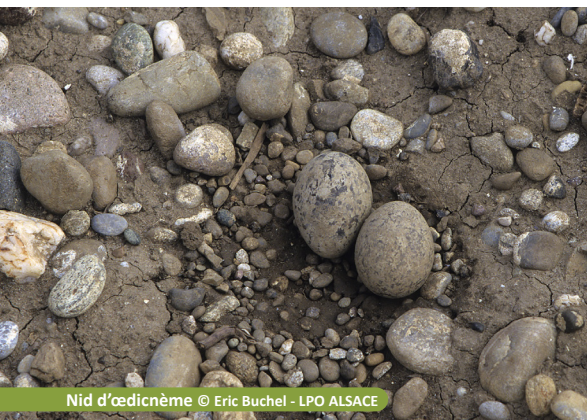
Nid d'œdicnème

Migrateur partiel, l'œdicnème criard est surtout observé dans notre région de mi-mars à novembre. Plus couramment nommé « Courlis de terre », cet oiseau apprécie les milieux ouverts et caillouteux .