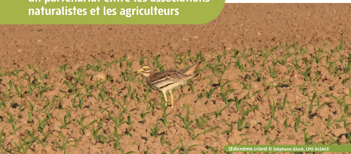
Oedicnème criard

Suivi et protection : un partenariat entre les associations naturalistes et les agriculteurs