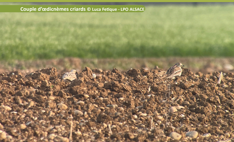
Couple d'œdicnèmes criards

Lors des travaux agricoles, la présence d'un nid peut être décelée lorsqu'un ou deux adultes s'éloignent tardivement à l'approche du tracteur. Ce type de comportement est un indicateur de la présence d'œufs ou de jeunes poussins.