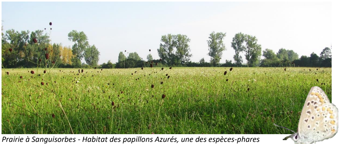
Prairie à Sanguisorbes - Habitat des papillons Azurés, une des espèces-phares