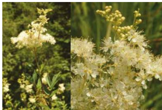
Reine des prés