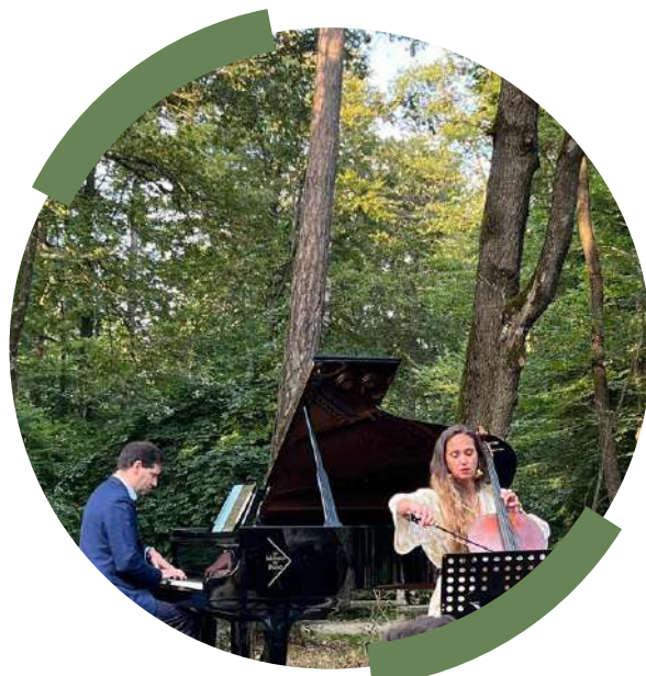
Concert dans la forêt des Faux de Verzy au bénéfice de la forêt - 30 août 2023

En développant des paiements pour services environnementaux et en permettant la création de 200 hectares d’îlots de sénescence qui témoignent de l’engagement en faveur de la préservation de zones forestières en libre évolution, essentielles pour maintenir l’équilibre écologique.